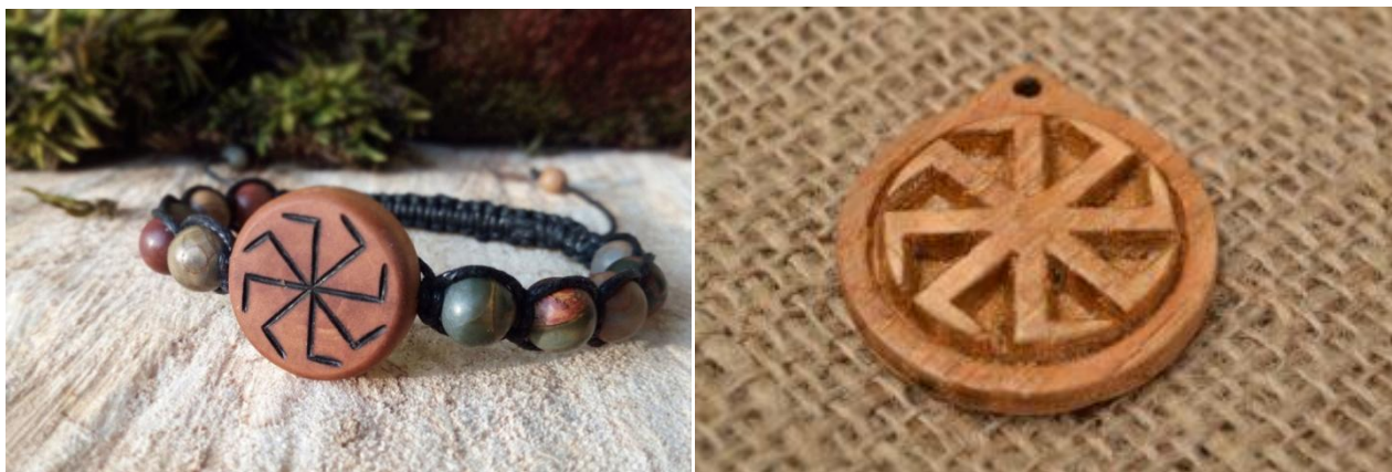
Примеры современного браслета-оберега и кулона с Коловратом

Среди обычного населения была распространена немного иная тенденция: браслеты выполнялись из самых обычных материалов. В качестве материалов применяли нити и ткани, дерево и не более того.